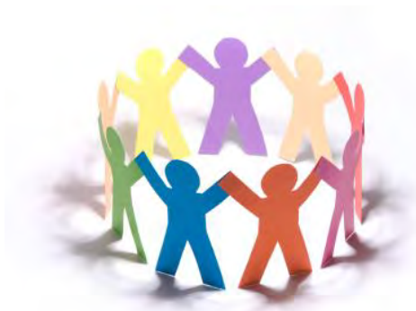
קהילות פיתוח פדגוגי בית-ספריות