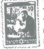
בול הקרן הקיימת